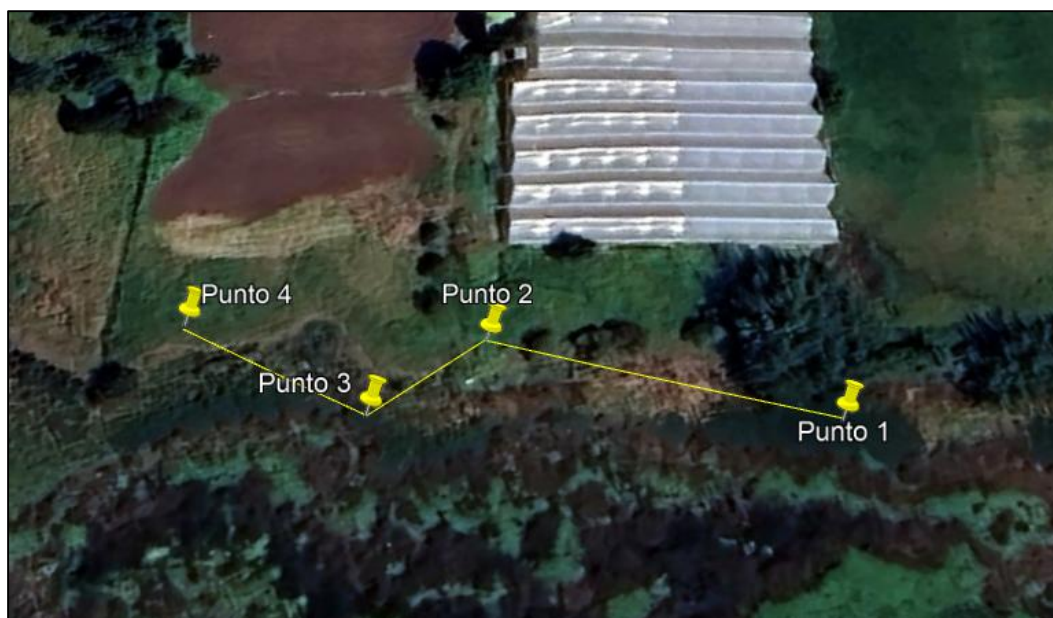
Ilustración 1. Recorrido

Con base en lo anterior, el día 06 de agosto de 2025 se realizó recorrido de control y vigilancia en el humedal Gualí desde las coordenadas 4°42'13" N-74°11'46" W hasta las coordenadas 4°42'12" N-74°11'49" W (ver ilustración 1. Ruta amarilla) vereda El Hato, ecosistema que fue declarado por la Corporación Autónoma Regional de Cundinamarca - CAR como Distrito Regional de Manejo Integrado a través el acuerdo 001 de 2014 "Por medio del cual se declaran como Distrito Regional de Manejo Integrado (DMI), los terrenos comprendidos por los humedales de Gualí, Tres Esquinas y Lagunas de Funzhé, y su área de influencia directa ubicada en los municipios de Funza, Mosquera y Tenjo, Cundinamarca", y estableció tres zonas: 1. Preservación (espejo de agua), 2. Recuperación (50 metros) y 3. Uso sostenible (100 metros).